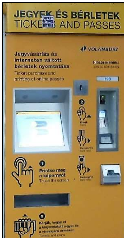
Volánbusz jegyárusító automata

Ezért alábbi képeken bemutatjuk, hogy melyik automatából melyik közlekedési eszközre váltható menetjegy.