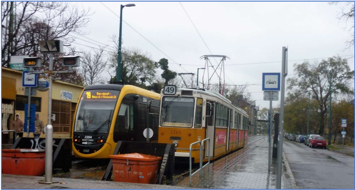
A 19-es és 49-es villamosok végállomása a Kelenföldi Pályaudvarnál / Busz Pályaudvarnál (pontos elhelyezkedése a 10. oldalon található térképen látható)