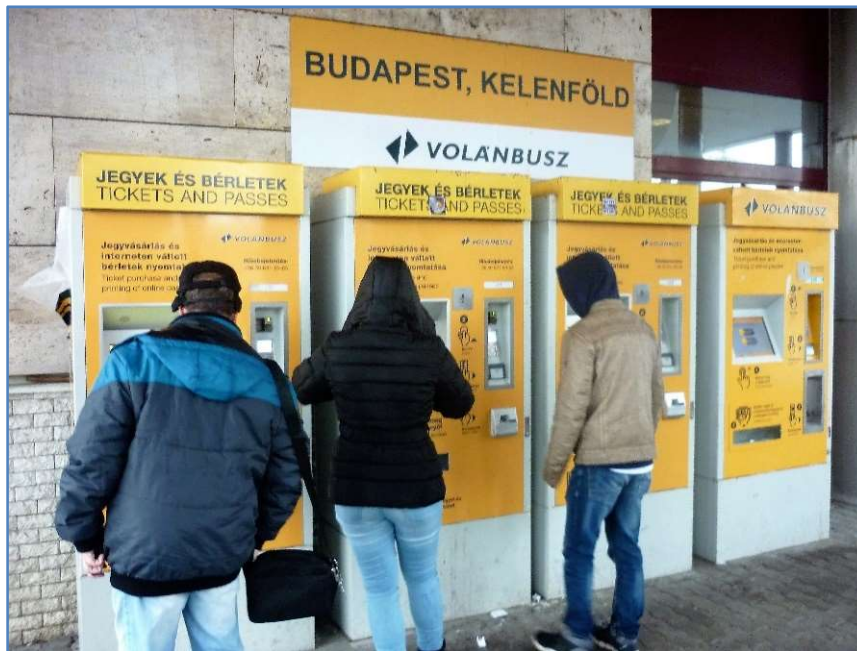
Volánbusz jegyautomata Kelenföld Volánbusz-végállomáson