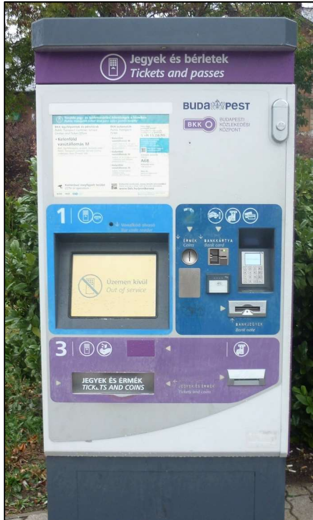
BKK jegyárúsító automata