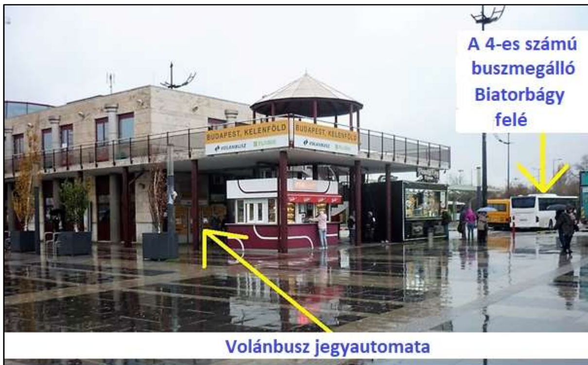
A Volánbusz-végállomás Kelenföldön, közvetlenül a Kelenföldi Pályaudvar mellett, innen indulnak a távolsági buszok Biatorbágyra (a 4-es számú állomásról).