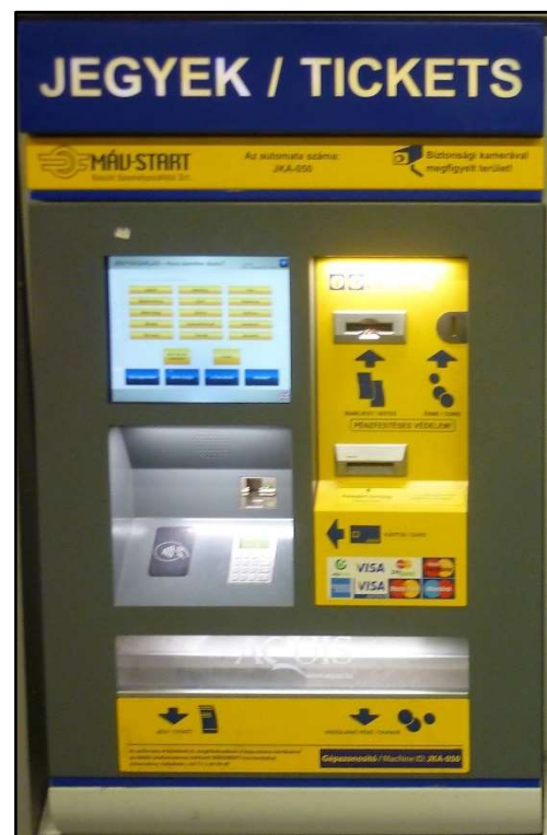
Máv-Start jegyárusító automata