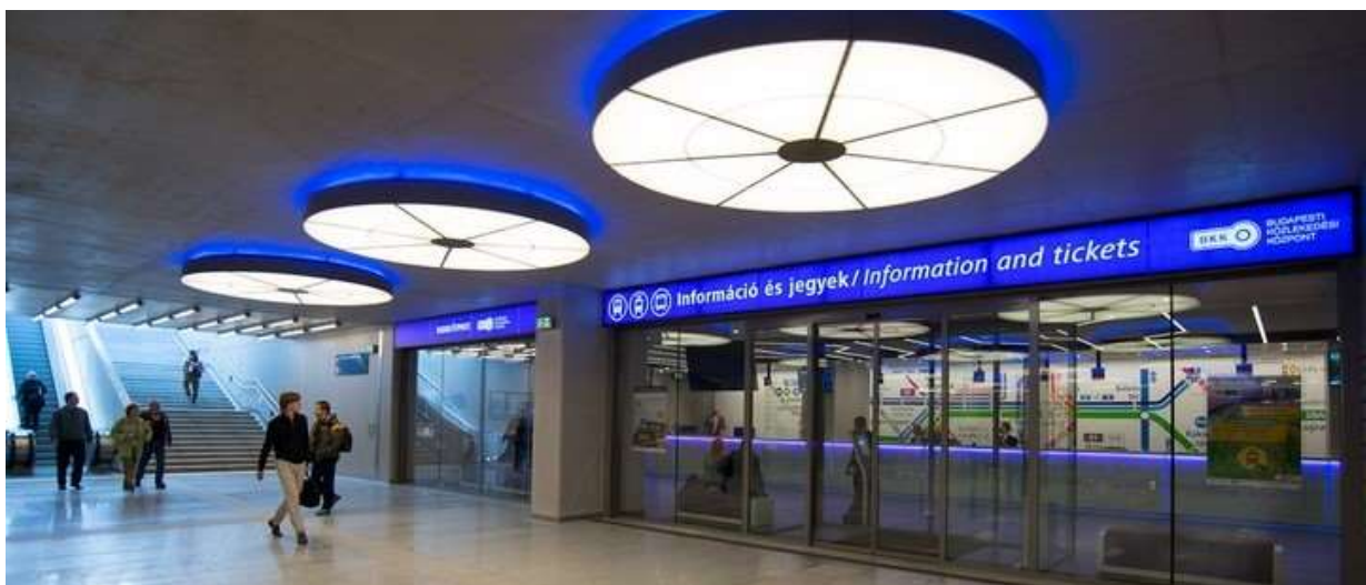
BKK Ügyfélközpont a Kelenföldi Pályaudvar aluljárójában